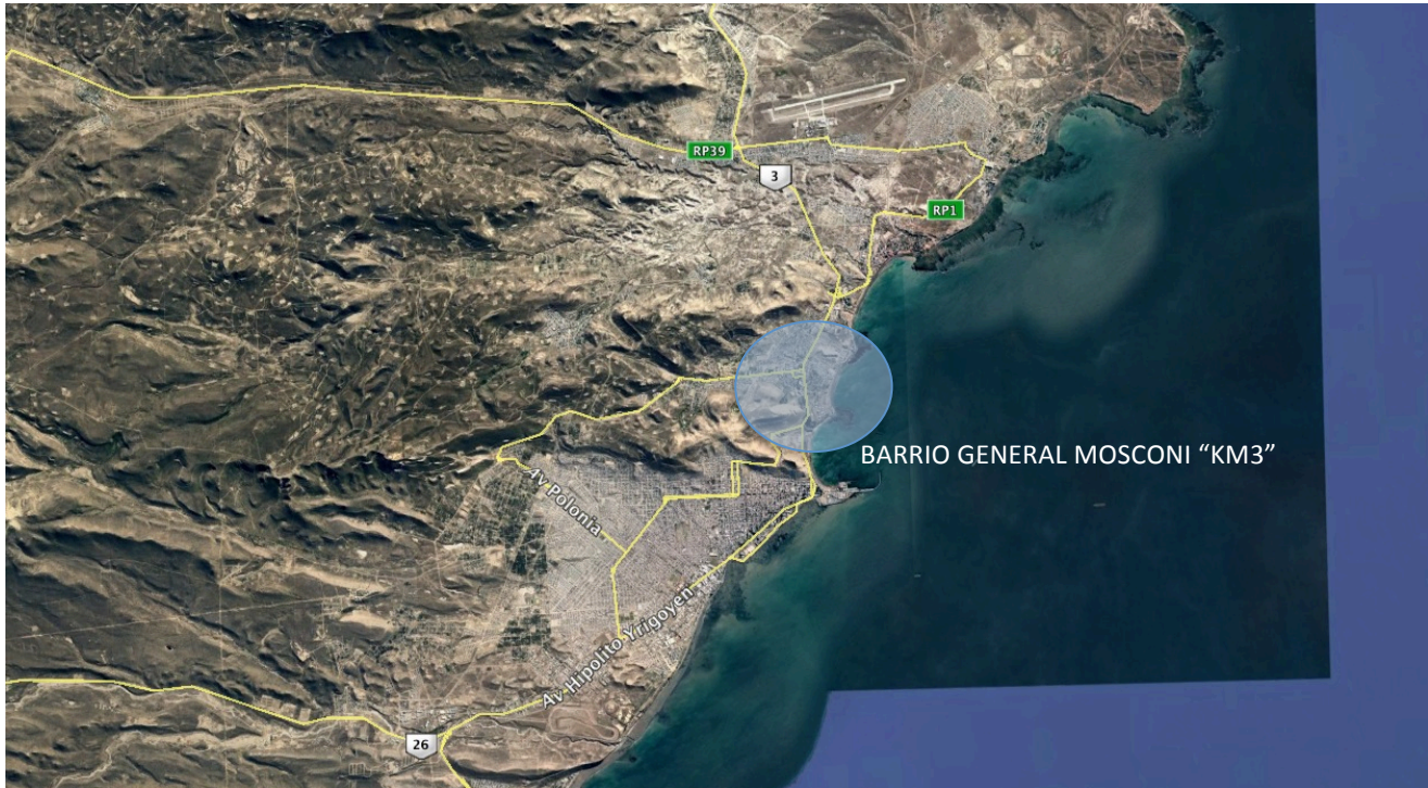
Imagen Satelital de la ciudad de Comodoro Rivadavia

Las líneas amarillas representan las vías de conectividad (interurbana y regional) de la ciudad de Comodoro Rivadavia